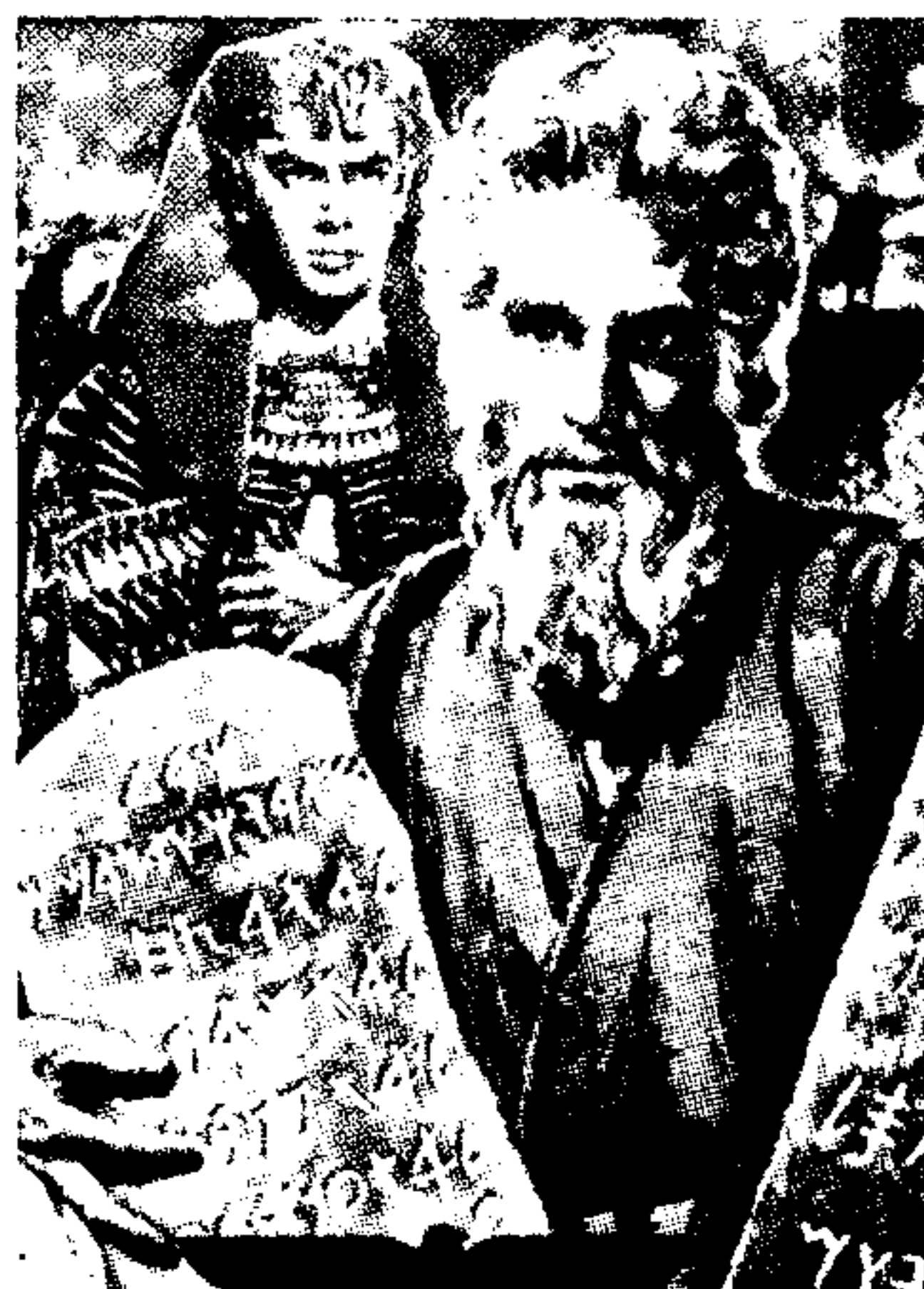
La mítica película

Planteadas en dos líneas narrativas, con diferente numeración, Busquets alterna los estudios bíblicos con la peripecia de un profesor barcelonés, poseedor de unas tablas de arcilla envueltas en celofán. Un documento mosaico en cursiva egipcia que puede socavar las tres religiones monoteístas. Así lo ve uno de los personajes: «Y si es un documento apócrifo... Iniciaré un debate entre expertos que será una guerra. Según la Biblia, nadie sabe donde murió Moisés. Los musul-