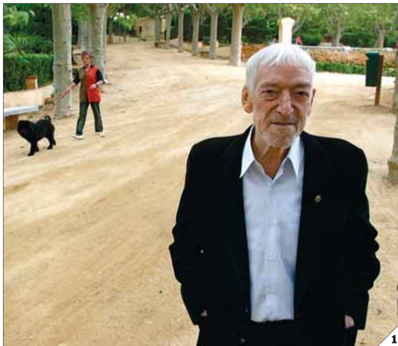
1. Vicente Ferrer 2. Jordi Pujol 3. Oriol Bohigas

Aquesta sèrie d'entrevistes en profunditat, elaborada en coproducció amb la productora Batabat, consta de 13 edicions d'una hora de durada que duran a la pantalla Vicente Ferrer, Jordi Pujol, Fabià Estapé, Rosa Regàs, Frederic Mayor Zaragoza, Moisès Broggi, Josep Maria Castellet, Jordi Sabater Pi, Neus Català, Vicente Aranda,