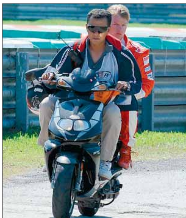
Kimi Räikkönen és portat al box després de quedar-se sense benzina a mig circuit havent fet només vuit voltes

Mentrestant, a la part alta Ferrari i Kimi Räikkönen van fer els millors temps a la primera sessió, però a la segona el monoplaça del finlandès es va quedar aturat després de vuit voltes. Oficialment, no li havien posat prou combustible. El ridícul va impedir que Räikkönen pogués provar els pneumàtics tous. Tot i així, va fer el segon temps i avui, si no hi ha badades, és favorit per obtenir la pole que ara, provisionalment, té Hamilton. ■