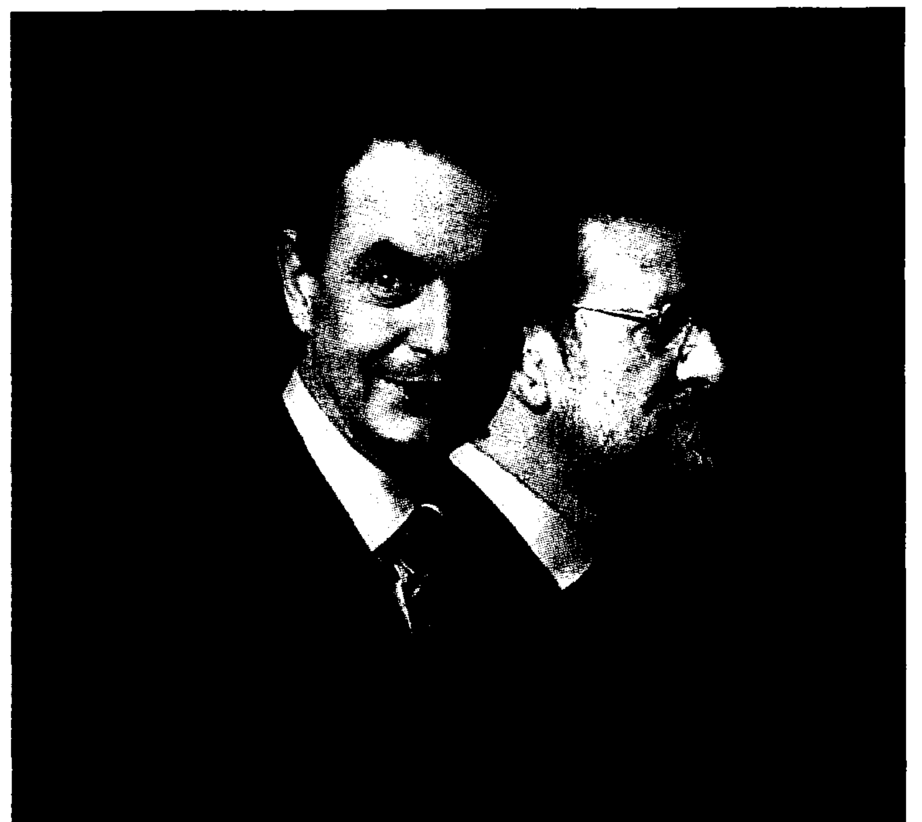
Zapatero y Rajoy, momentos antes del segundo debate televisivo.