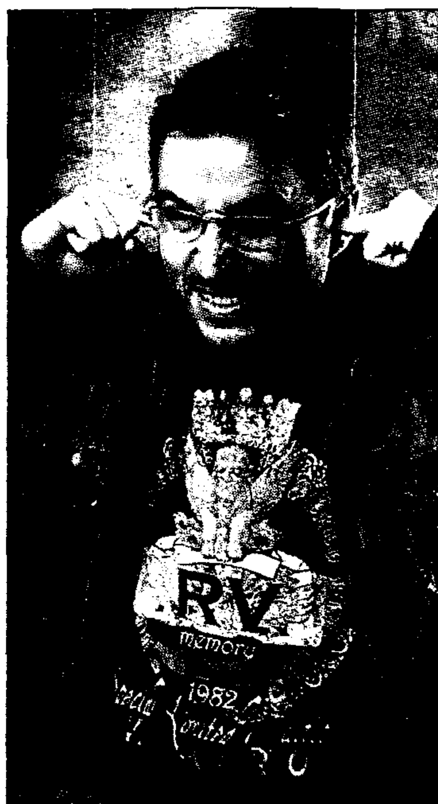
Jordi Évole, alias El Follonero.

La crónica que recogía el escepticismo con el que ha sido recibida por parte de sus correligionarios veteranos subió al segundo lugar, con más de 41.600 visitas. En tercera posición se colocó la indemnización de Salsa rosa a Juan Ramón Lucas. La Audiencia Provincial de Madrid ha dictado que el programa tendrá que pagar 50.000 euros al periodista por "intromisión ilegítima" en su intimidad (30.200 visitas).