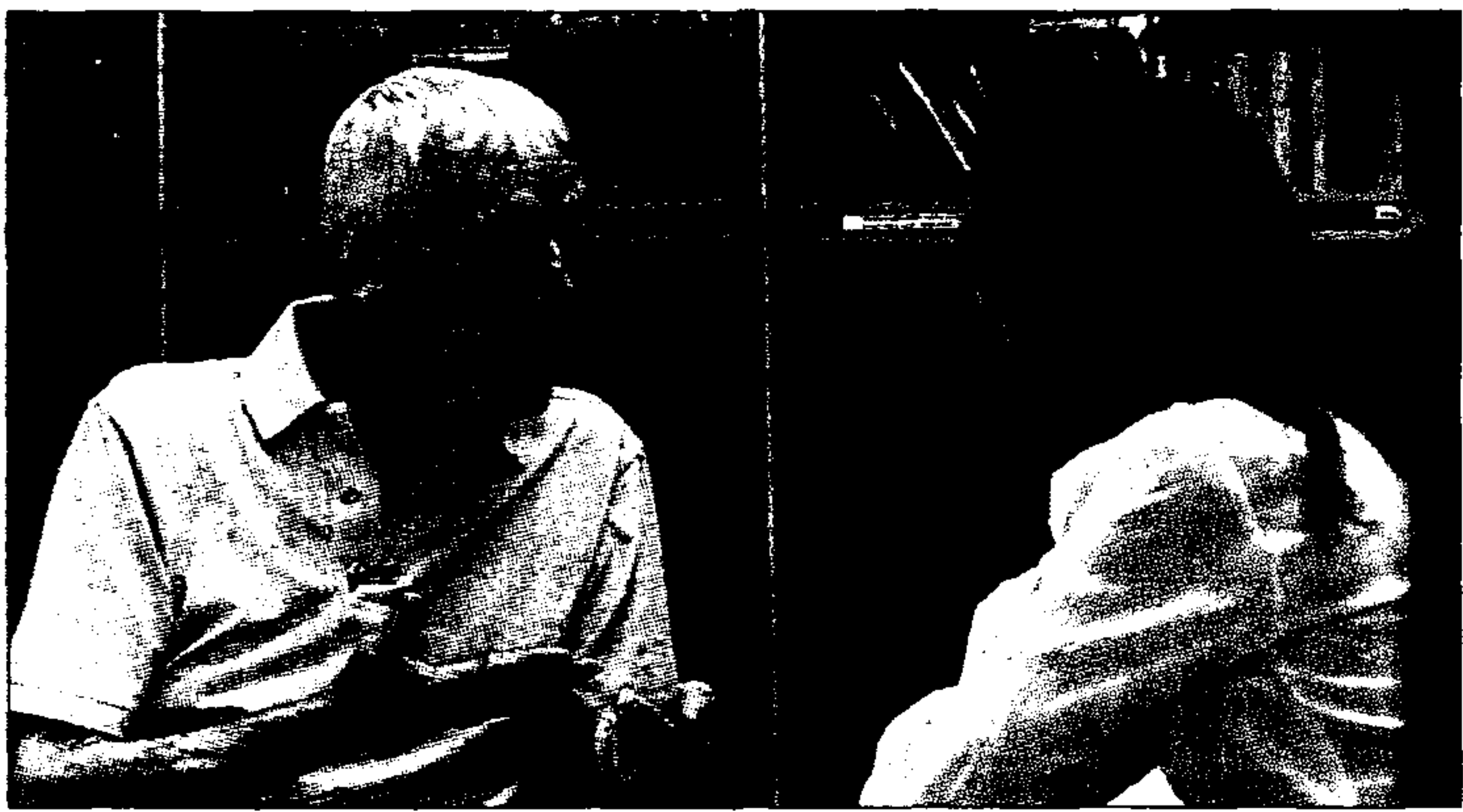
Programa dedicado a Vicenç Ferrer.