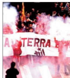
▶▶ Imatge del documental.

ra que ha intentat reflectir en 70 minuts l'evolució de l'organització de la manera més asèptica possible. Un exemple: en el documental no es parla mai de banda terrorista. «Aquí tenim una visió distorsionada d'aquest terme -diu-. Per exemple, a França i la Gran Bretanya parlen de bandes armades i, aquí, els jutges també utilitzen la forma de col·laboració o pertinença a banda armada. I aquest plantejament, neutral i imparcial, és el que busca el documental. No es parteix d'una tesi ni tampoc hi ha una conclusió. Tot s'elabora a partir de les declaracions dels