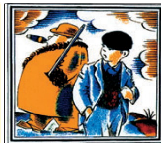
► El pareado Sent l'odi a l'home feixista / per tirà i poc altruista acompaña la ilustración de Josep Obiols del Auca del noi català, antifeixista i humà , un título de la colección. A la izquierda, dos portadas.

dura, haciendo especial énfasis en los años 30 y de la República», según explicó ayer el editor de la nueva Ara, Ernest Folch, en la presentación en la Biblioteca de Catalunya.