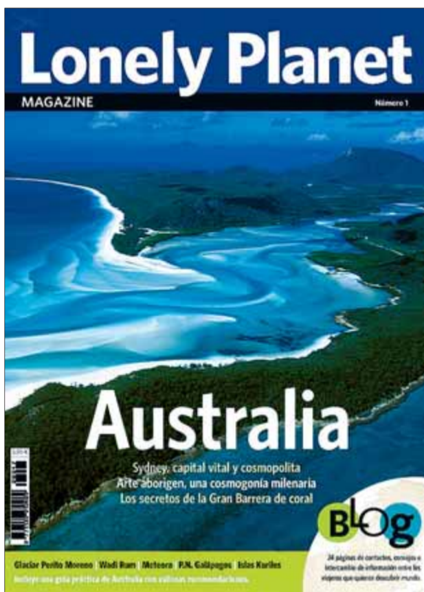
El primer número de la revista 'Lonely Planet' inclou una part monogràfica dedicada a Austràlia ■ LONELY PLANET

s'oferirà cada mes informació monogràfica sobre un país, ciutat o regió -Austràlia és la destinació escollida en el número de presentació-. Això sí, l'esperit que caracteritzarà aquesta informació serà el mateix que impregna les pàgines de les